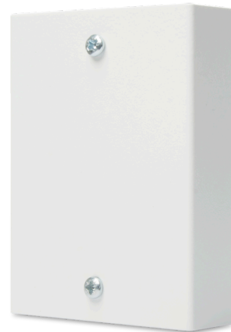
AD260M i metallkapsling